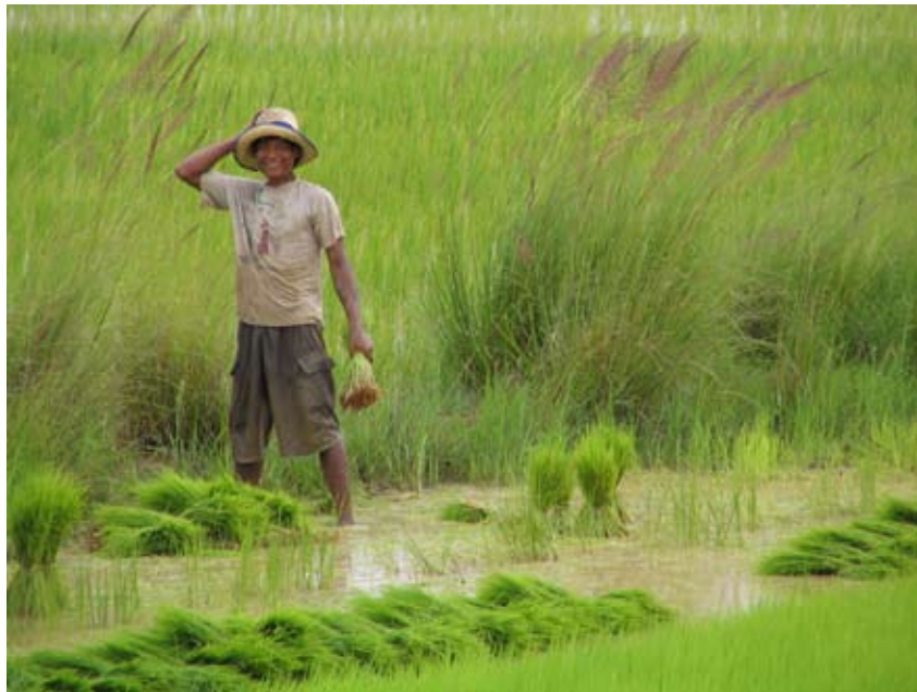
Kuva 2. Riisin viljelyä Kambodžassa.

FAO:n (2006) mukaan liha- ja maitotuotteiden kulutus kasvaa kaikkialla. Ihmisten keskimääräinen elintaso on nousussa, eikä väestönkasvu näytä hidastuvan vielä vähään aikaan. Samaan aikaan ihmisten kulutus- ja ruokailutottumukset muuttuvat, ja liha- ja maitotuotteiden käyttö lisääntyy; huiminta kasvu on kehittyvissä maissa. Sekä